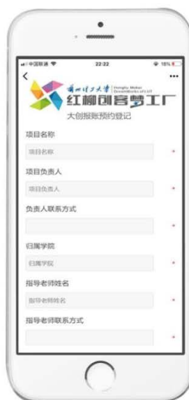
填写网站上所需内容无误后提交

备注：请各位老师、同学认真阅读报账流程，收到短信通知后，在规定时间内，到红柳创客梦工厂一楼大厅提交有关票据及审批单，如超过规定时间，请提交到红柳创客梦工厂二楼#208 大学生创新创业服务中心。