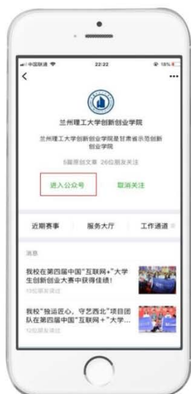
进入兰州理工大学创新创业学院微信公众号