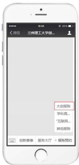
点击所需报账类别菜单栏