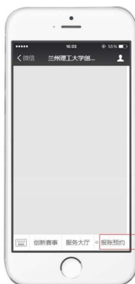
点击报账预约菜单栏